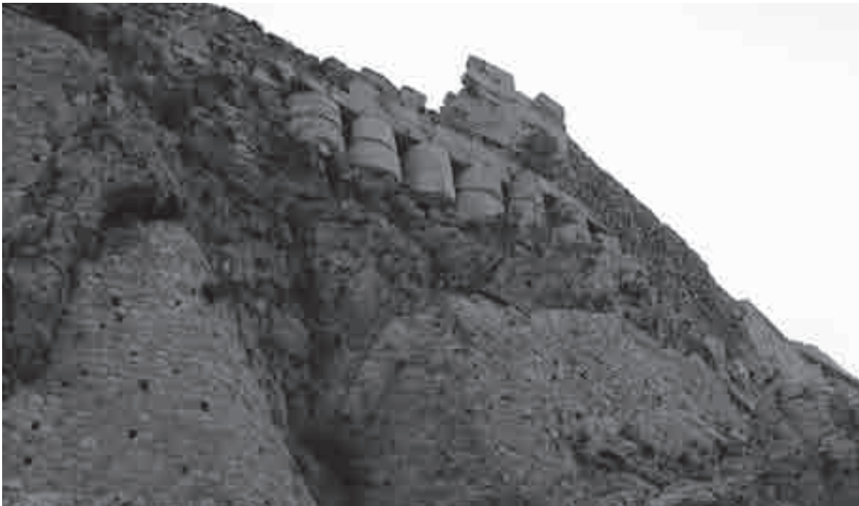
Il reimpiego di rocchi di colonne nel muro settentrionale dell'Acropoli

di bruciato. Il discorso sarebbe molto lungo se dovessimo rivedere tutte le evidenze che erano in piedi al momento del passaggio dei Persiani cui gli archeologi hanno attribuito la responsabilità di distruzioni o di danni (la stessa cosa accadrà con il saccheggio sillano dell'86 a.C. o quello degli Eruli del 267 d.C., date di eventi cui vengono associati livelli archeologici con un'immediatezza, spesso, a dir poco, sospetta; esemplare a riguardo Thompson 1981). Qui mi limito ad un breve accenno a tre elementi essenziali connessi con la presenza persiana: la cosiddetta colmata persiana sull'Acropoli, le mura di Temistocle, le case private.