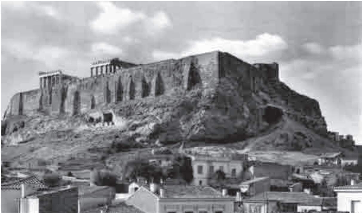
Le pendici sud-orientali dell'Acropoli (da Picard 1929)

alle falde orientali dell'Acropoli) era all'inizio della via dei Tripodi; quindi possiamo ubicare qui anche il Boukolion , seguendo l' Athenaiōn Politeia ; del consiglio dell'Areopago sappiamo che aveva sede presso la collinetta omonima, niente possiamo dire dell' Epilykeion e del Thesmotheteion , ma non credo che sia aleatorio ipotizzare che non dovevano essere lontani, anzi con il progredire delle riforme costituzionali (i tesmoteti furono creati per ultimi, v. Athenaiōn Politeia 3.4) devono essere stati eretti poco alla volta gli uffici per ospitare le nuove magistrature al punto da farci immaginare che quello spiazzo, all'inizio simile all'agora dello scudo di Achille o a quella di Scherie, sia venuto poco alla volta a riempirsi di edifici lungo i suoi bordi.