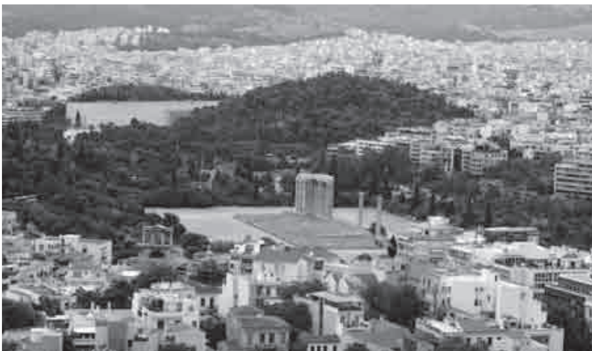
La valle dell'Ilisso con l'Olympieion. Sullo sfondo lo stadio tra le alture dell'Ardetto

Messe da parte le pretese di immaginare che il Pythion nella Valle dell'Ilisso fosse il duplicato del culto praticato nella grotta sotto l'Acropoli (da ultimo Greco 2009a) non resta che trarre partito dal fatto che Strabone (9.2.11) afferma che l' eschara di Zeus Astrapaios stava dentro le mura tra l'Olympieion e il Pythion . Dall' eschara di Zeus si osservava il cielo per verificare se il monte Harma, vicino al Parnete, mandava lampi e quindi era lecito far partire la processione della Pitaide strettamente dipendente dal manifestarsi del bagliore (sulla via della Pitaide v. Ficuciello 2008, 26-33).