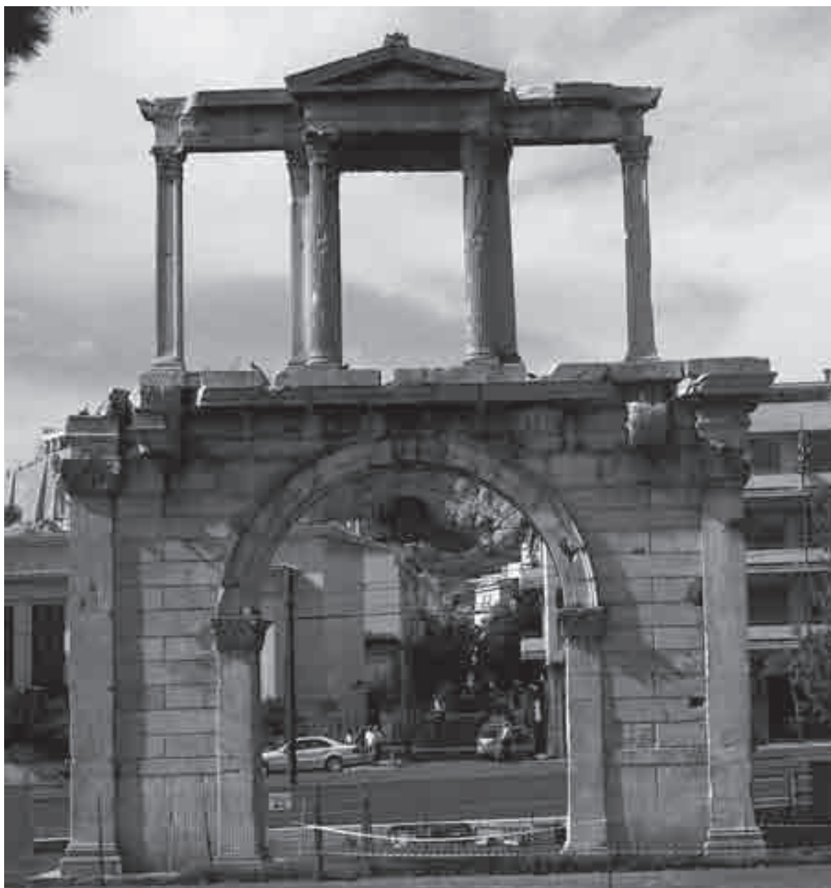
La Porta di Adriano da est

Adriano, l'imperatore filello per eccellenza, investirà molte energie nei grandi progetti architettonici che segnano l'ultima grande fase edilizia ateniese, al punto che sarà salutato come novello Teseo, come il nuovo fondatore della città. E non per caso, se si considera il gran numero di interventi nell'edilizia monumentale, che cambieranno radicalmente l'assetto urbano, trasformando il centro di Atene in quello di una città romana imperiale, in modo molto più determinante rispetto ai limitati interventi operati in precedenza.