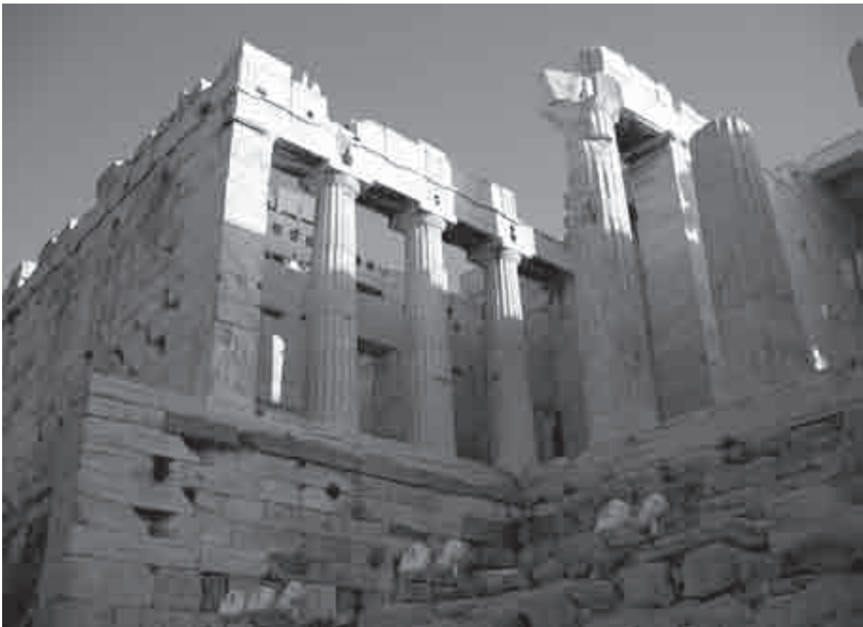
L'ala settentrionale dei Propilei. In alto, l'Acropoli da ovest