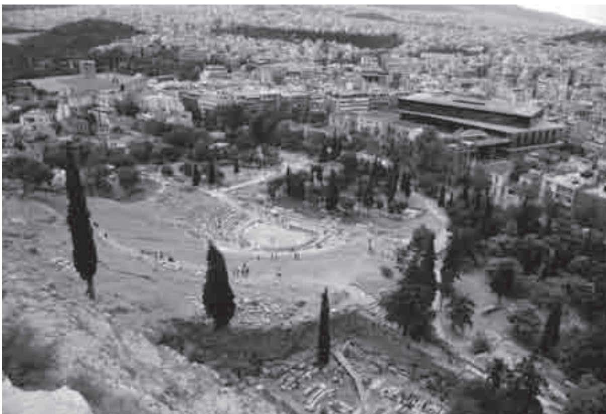
Il teatro di Dioniso e il nuovo Museo dell'Acropoli