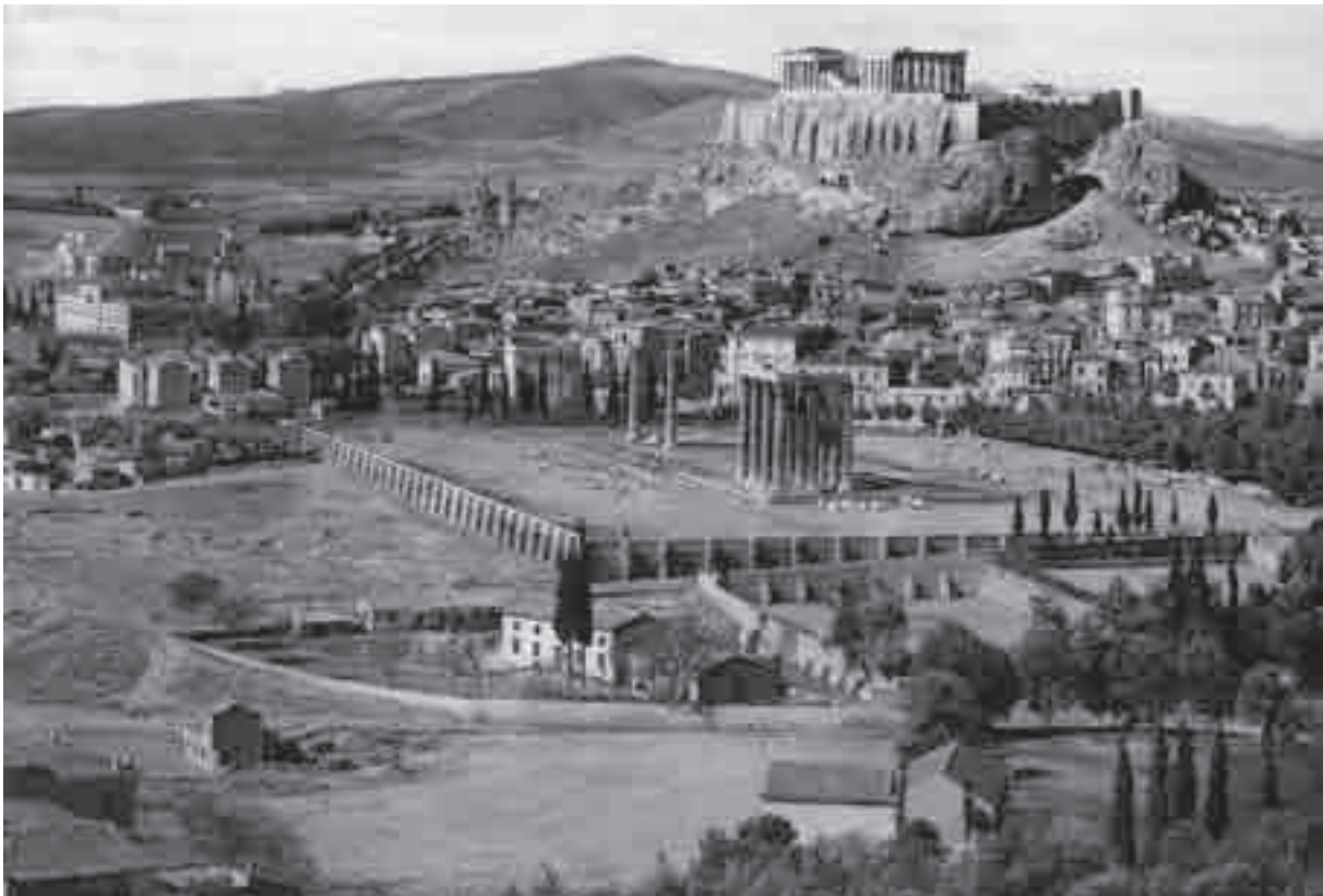
Veduta dell' Olympieion e dell'Acropoli (da Picard 1929)

del dio dall'Accademia al teatro situato alle pendici dell'Acropoli. Inoltre, se l'Orchestra è un topos epiphanes per lo svolgimento di feste e non spazio adibito a performances teatrali potrebbe, secondo l'ipotesi della Kotsidu (1991), aver ospitato gli agoni musicali delle Panatenee, donde forse emigrarono nell' Odeion di Pericle (più probabile soluzione rispetto alla permanenza nell'Agora, anche dopo, come vorrebbe la Kotsidu).