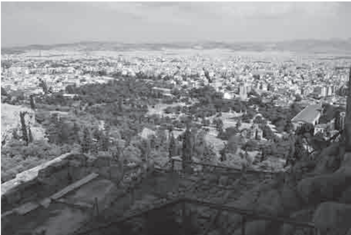
Veduta dell'Agora dai Propilei. In alto, l'Acropoli da nord